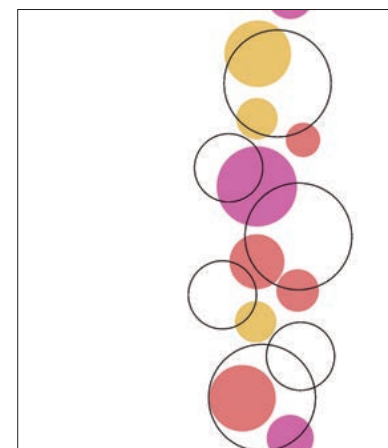
AGUA 3-1373, pink