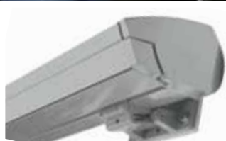
TRENDLINE CASSETTE Max. Anlagengröße einteilig: 7 x 3,5 m zweiteilig: 12 x 3,5 m