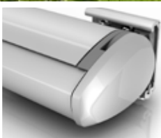
TRENDLINE SMARTBOX Max. Anlagengröße einteilig: 5,5 x 3,5 m