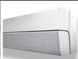
TRENDLINE SUNBOX Max. Anlagengröße einteilig: 6 x 3,5 m