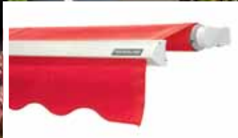
TRENDLINE Max. Anlagengröße einteilig: 7 x 3,5 m zweiteilig: 14 x 3,5 m